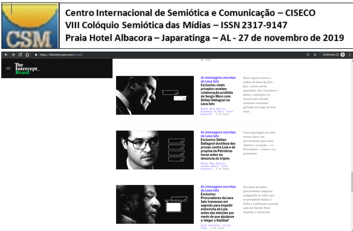
Figura 1: Imagem das reportagens no feed de notícias do The Intercept Brasil

A primeira plataforma que mapeamos é o próprio site do The Intercept Brasil , no qual é possível que os leitores compartilhem as reportagens no Facebook, no Twitter, e por e-mail, além de poderem deixar comentários em espaço reservado ao fim da notícia. Também exploramos os outros perfis que a agência de notícias mantém ativo em plataformas como Instagram, Youtube, agregadores de notícias como o Flipboard e o Google Notícias, e o canal aberto de interação com os leitores através da Newsletter e da lista do Whatsapp.